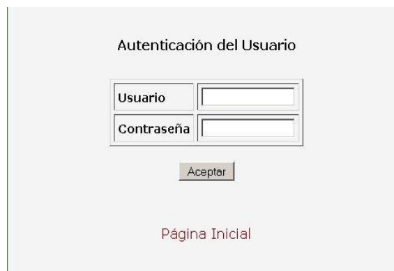
Figura 1 - Autenticación de usuario

Para hacer uso de la aplicación es necesario estar registrado en el sistema, teniendo asignado un login y una contraseña, los cuales deben ser ingresados en el formulario de autenticación. Figura 1