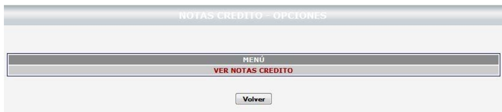
Figura 4 – Opciones Notas crédito

Una vez que se realiza la anterior opción, se marca clic en Ver notas crédito de la ventana de Notas crédito Opciones. Figura 4