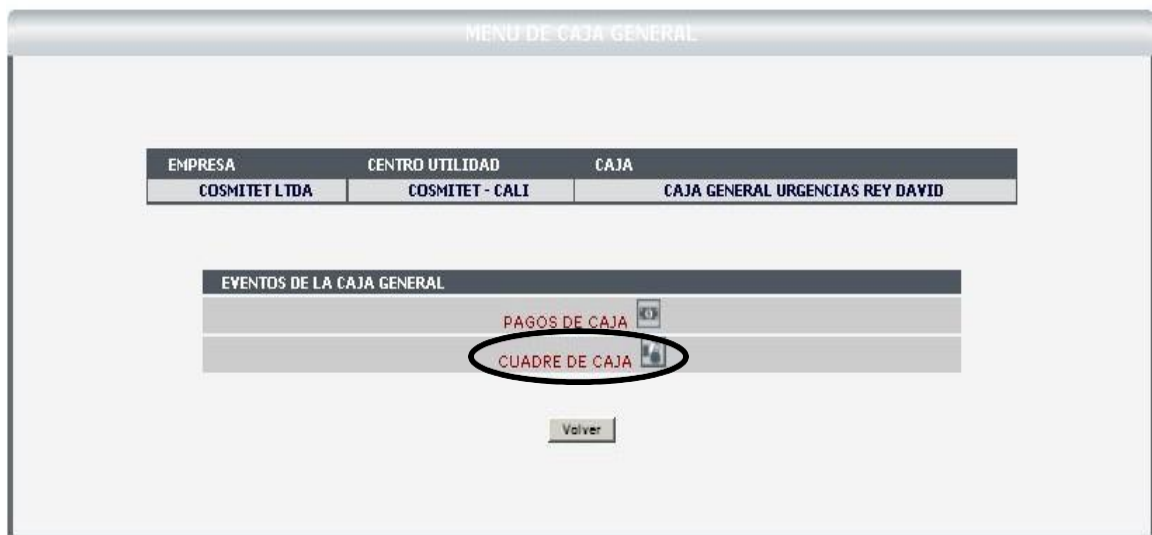
Figura 4 – Menú Cuadre de caja

Cuadre de caja : proceso que debe realizarse diariamente al terminar el turno. El proceso de cuadre consiste en realizar un arqueo de caja, revisando los soportes físicos de las operaciones registradas en el sistema los cuales deben ser igual a la plata existente. No implica que la caja quede en cero, se realiza un corte de las operaciones realizadas.