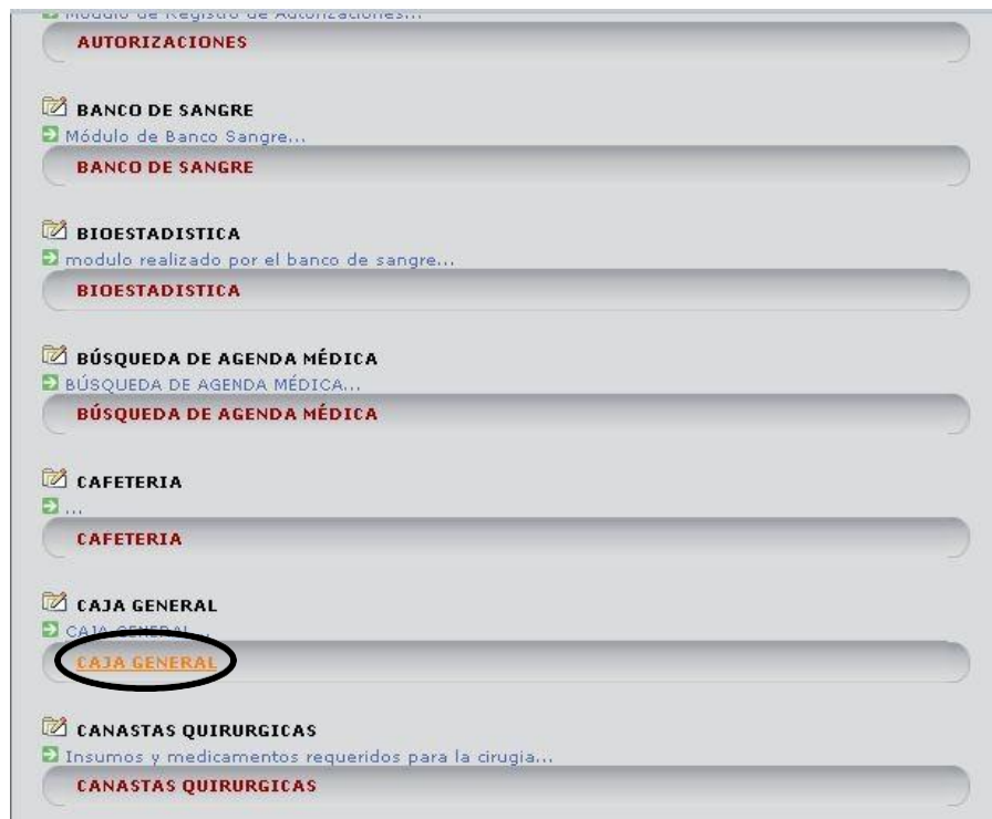
Figura 2 – Menú Caja General

Para comenzar se ingresa por el menú principal buscando con las teclas CTRL F la opción CAJA GENERAL . Figura 2