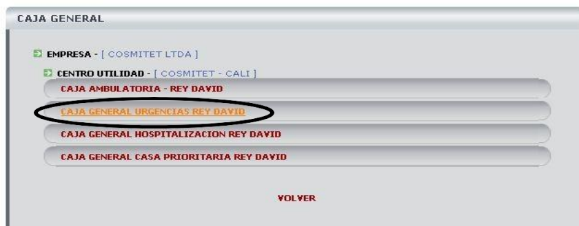
Figura 3 – Centro de utilidad

Una vez se ha ingresado a la siguiente ventana se selecciona el Centro de Utilidad del cual se requiere realizar el proceso de Caja. Figura 3