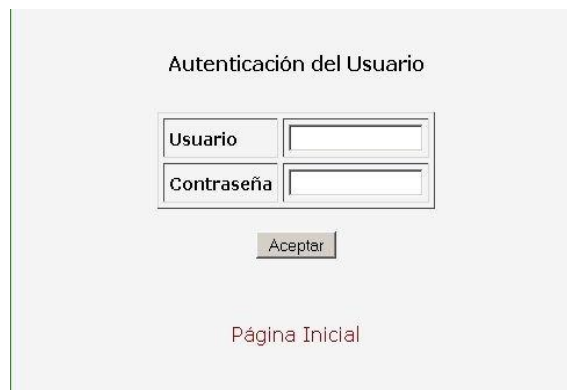
Figura 1 - Autenticación de usuario

Para hacer uso de la aplicación es necesario estar registrado en el sistema, teniendo asignado un login y una contraseña, los cuales deben ser ingresados en el formulario de autenticación. Figura 1