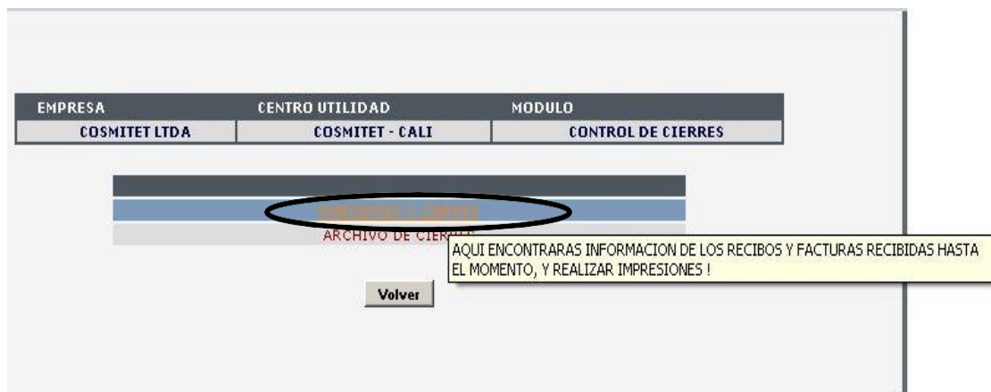
Figura 10 – Menú control de cierres

Una vez se ha seleccionado el centro de utilidad en la siguiente ventana de Menú Control de Cierres se debe marcar clic en la opción de Pendientes por Cierre. Figura 10