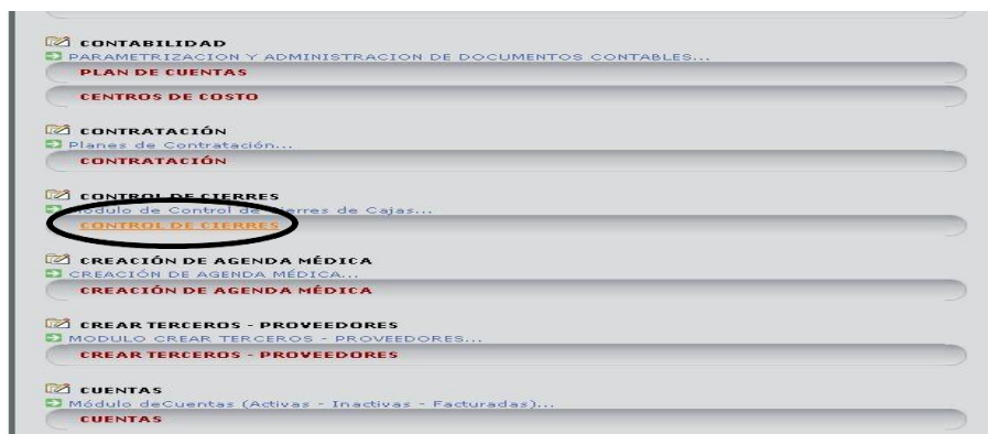
Figura 8 – Control de cierres

El ingreso a la opción CONTROL DE CIERRES se realiza desde el menú principal facilitando la búsqueda con las teclas CTRL F. Figura 8