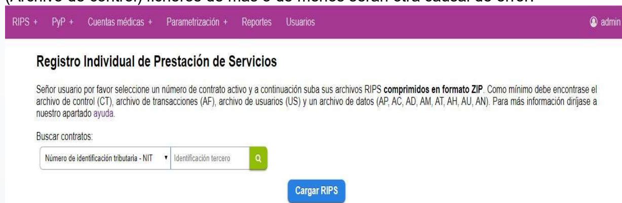
Figura 4 - Validador

Todo archivo que se desee subir por medio de la plataforma debe encontrarse comprimido en formato ZIP cualquier otro tipo de formato será omitido con su respectivo error. Dentro del archivo comprimido deben encontrarse exactamente los archivos descritos por el CT (Archivo de control) ficheros de más o de menos serán otra causal de error.