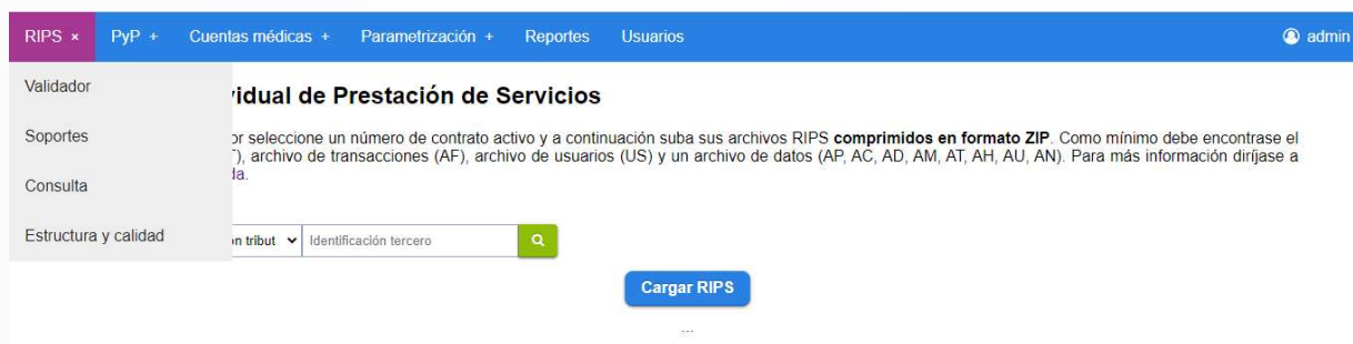
Figura 3 - Menú Rips