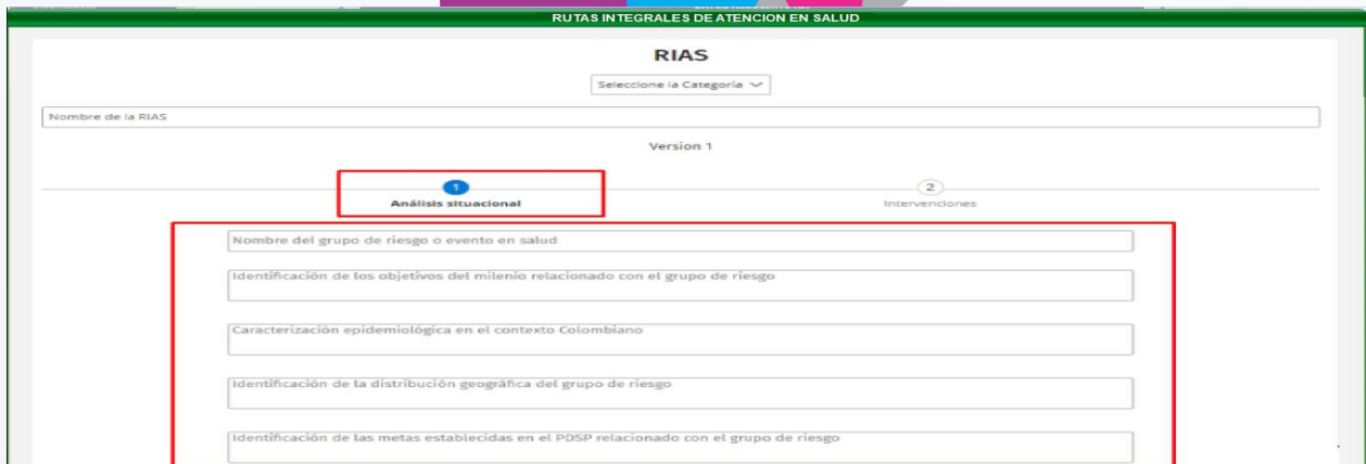
Figura 3 - Parametrización Análisis Situacional.

Por medio de este formulario se permitirá identificar los objetivos, caracterizar e identificar el grupo del riesgo.