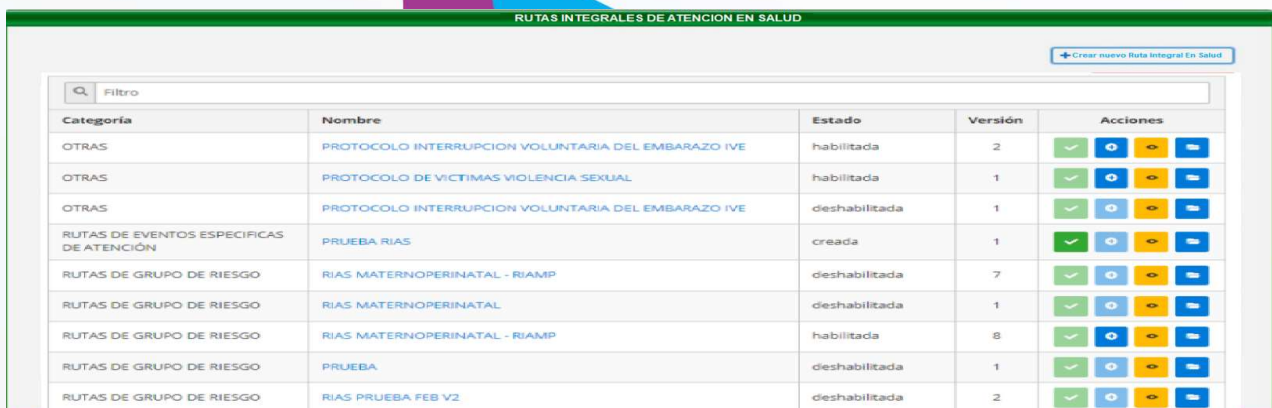
Figura 1- Creación Rias