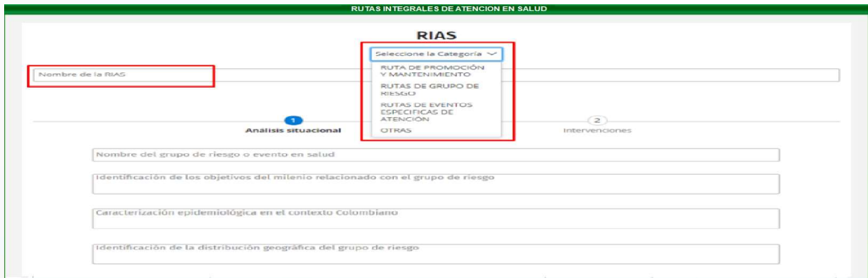
Figura 2 - Parametrización Rias.

En el siguiente formulario se selecciona la Ruta para llevar a cabo la parametrización del Análisis Situacional y las Intervenciones.