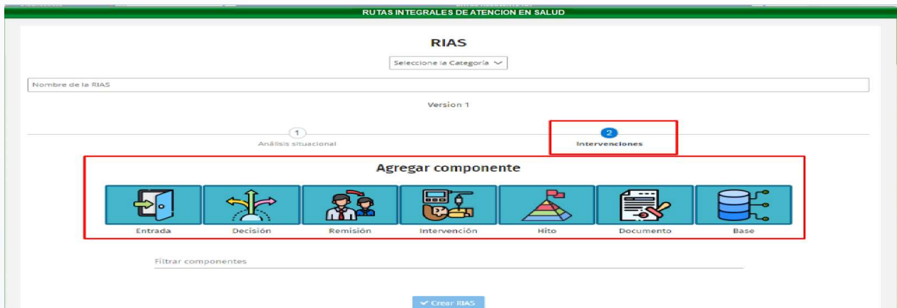
Figura 4- Intervenciones.

Este formulario permite agregar los diferentes componentes para orientar y ordenar la gestión de la atención integral en salud a cargo de los actores del SGSSS de manera continua y consecuente.